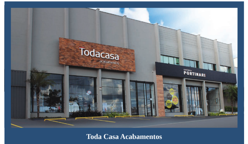
Toda Casa Acabamentos

Delmond dá a dica para aqueles que desejam ambientes que transmitam uma sensação de calma e aconchego, utilizando pisos laminados de madeira. “Os da marca Durafloor, que também são conhecidos como piso quente, são muito utilizados em dormitórios e salas. São confortáveis para quem tem o hábito de andar descalço e favorecem a combinação com móveis e objetos. Possuem grande praticidade em limpeza e instalação, além de dispensar o lixamento e envernizamento necessários a outros pisos de madeira. Eles também contém