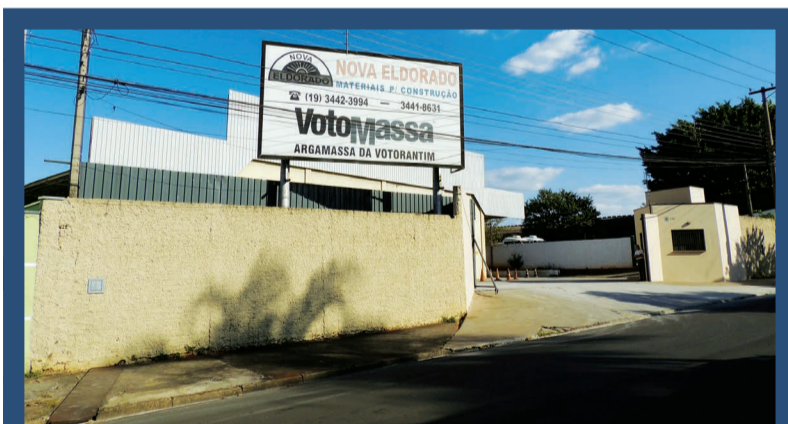
Nova Eldorado Materiais para Construção

A mudança no perfil dos usuários foi o que facilitou e permitiu a formulação de preços mais acessíveis com alternativas para curtos períodos, a partir de uma diária. “Importante ressaltar que, no ato de locação é firmado entre as partes um contrato de cessão de bens sem operador, quando o locatário assu-