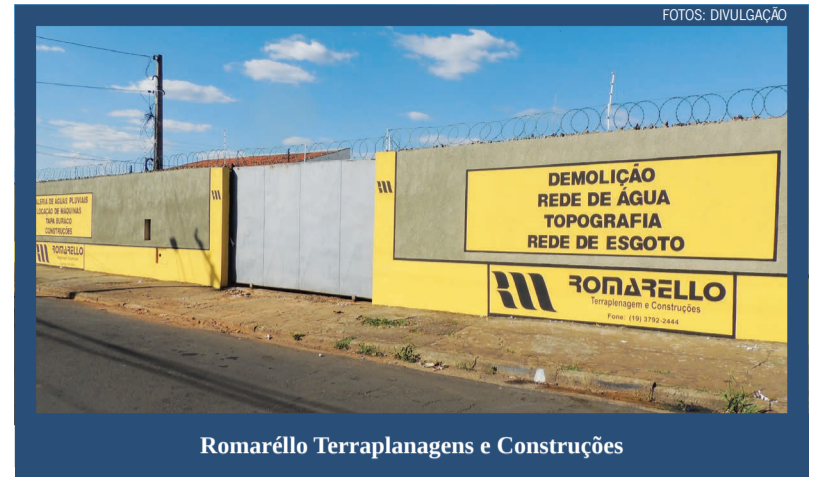
Romaréllo Terraplanagens e Construções

É nesta fase que iniciará a fundação (estacas, baldrames e pilares), que irão sustentar toda a construção. Ferro, cimento, concreto e aço em vergalhões e armados são os principais materiais utilizados nesta etapa e a sua qualidade é essencial para que não afete o restante dos trabalhos. “A base, que é o início, é primordial para que não ocorra rachaduras na obra. Nós trabalhamos com aço e telas de tops de mercado, como o AÇO CA-50 e AÇO CA-60 que são produzidos em siderúrgicas com selos documentados de certificação. Porém, existem no nosso ramo a oferta de outras empresas com