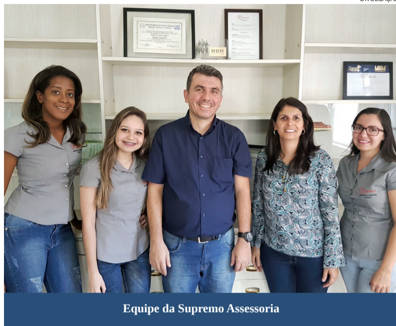
Equipe da Supremo Assessoria

Para aqueles que procuram profissionais comprometidos e totalmente capacitados na área